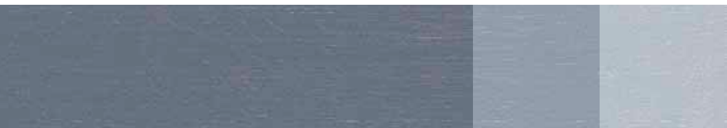
Hardebergablá NCS 5311-R78B 50% Vit Titan-Zink 75% Vit Titan-Zink