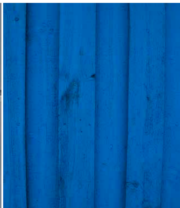
| Mild gråblå färgton på köksinredning | Färgstarkt fasadparti med åldrad koboltblå