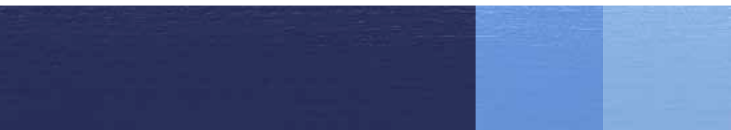
Ultramarinblá NCS 5742-R66B* 50% Vit Titan-Zink 75% Vit Titan-Zink