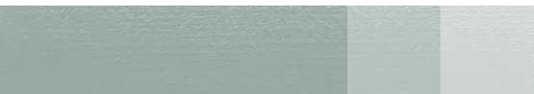
Veronagrá NCS 3108-B75G RAÁ kod - 4B-264 50% Vit Titan-Zink 75% Vit Titan-Zink