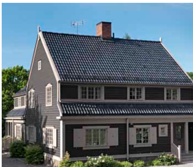
| Renoverat fönster i tyskt 1600-tals hus | Borggården, Stockholms slott | Svarta villorna i Stockholm byggdes 1914