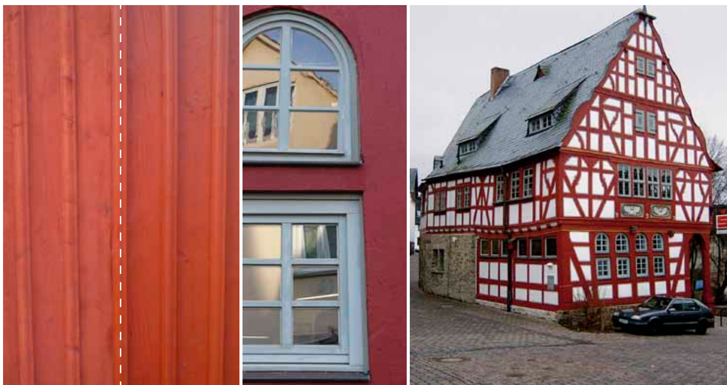
| Genarpsröd, åldrad i 15 år | Uppfräschad med en strykning | Rött och grått blir ofta en vacker kombination | Det gamla rådhuset i Niederbrechen, Tyskland

Notera att vi har en linoljefärg som heter Genarpsröd. Den är ett alternativ till slamfärgen i väderutsatta lägen. Bilden nere till vänster visar Genarpsröd struken en gång åldrad 15 år på fasad i söderläge. Till höger i bilden visas en uppfräschning med en strykning. Notera att färgen inte skiljer sig nämnvärt efter 15 år. Det beror på att vi använder mycket järnoxidrott pigment utan utdrygning av billigare fyllnadspigment. |